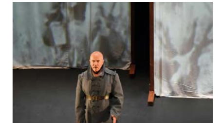
Spectacle de Yann-Fañch Kemener