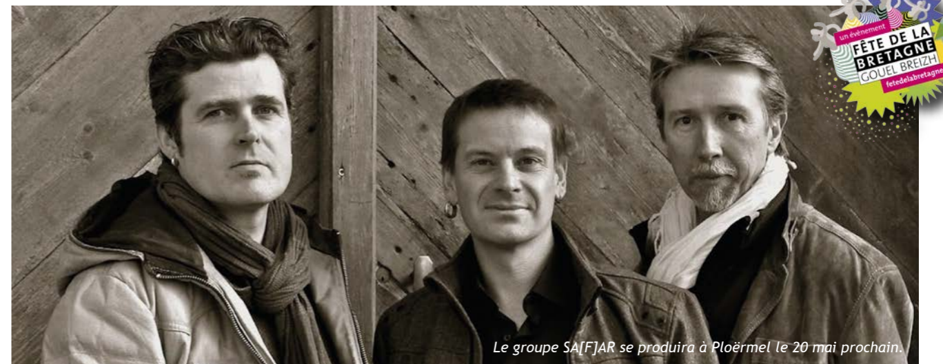
Le groupe SA[F]AR se produira à Ploërmel le 20 mai prochain.

La fête de la Bretagne c'est aussi à la médiathèque ! Pour l'occasion, l'équipe vous propose une sélection littéraire au goût salé !