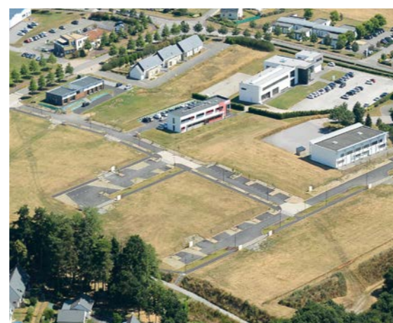
Vue du parc d'activités sur lequel s'implantera la structure.

Ce projet repose sur le transfert partiel de la structure existante actuellement située à Plumelec. La nouvelle structure devant être située à proximité du centre-ville, la ville de Ploërmel a proposé à l'association, une parcelle sur le P.A. de Ronsouze, permettant une proximité avec le Centre des Arts Martiaux et la résidence Le Phare. Avec une surface d'environ 9 700 m 2 , le projet pourra réunir l'ensemble des besoins de l'association.