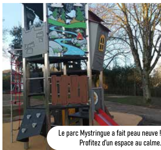
Le parc Mystringue a fait peau neuve ! Profitez d'un espace au calme.