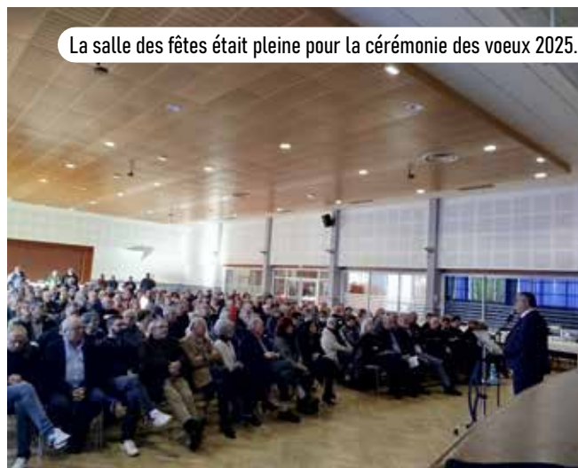
La salle des fêtes était pleine pour la cérémonie des vœux 2025.