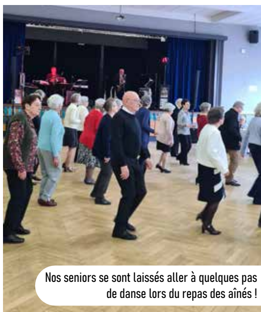
Nos seniors se sont laissés aller à quelques pas de danse lors du repas des aînés !