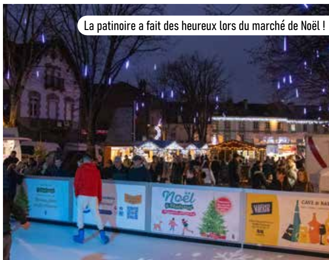
La patinoire a fait des heureux lors du marché de Noël !