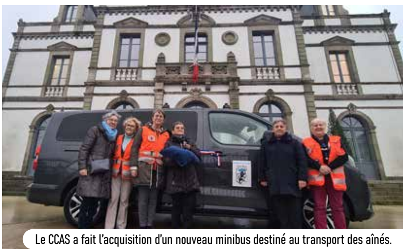
Le CCAS a fait l'acquisition d'un nouveau minibus destiné au transport des aînés.